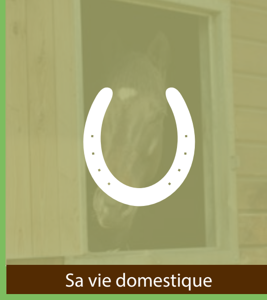
Sa vie domestique